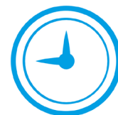
Don de temps