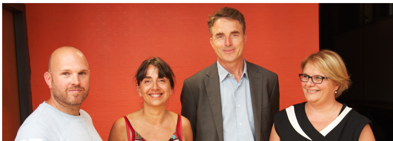
La MAIF rend visite à l'équipe Payname